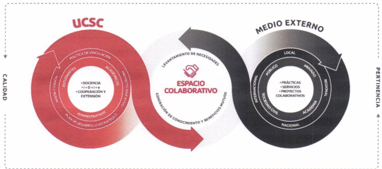
Figura 1. Modelo de Vinculación con el Medio Externo UCSC