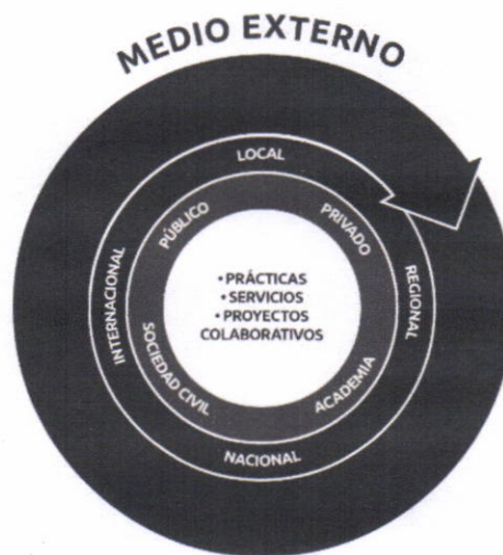
Figura 4. Representación del medio externo, modelo de Vinculación con el Medio UCSC

El territorio, considerado como el espacio físico donde convergen los actores, es un elemento de acción e interacción relevante en el Modelo de Vinculación desde el ámbito local, regional, nacional e internacional. Esta acción e interacción con los agentes del medio de los sectores público, privado, academia y sociedad civil se lleva adelante por medio de diversos mecanismos, como son las prácticas profesionales, la entrega de servicios y la ejecución de proyectos colaborativos. De manera que, tal y como lo grafica el modelo, la relación continua y permanente con el medio externo, permite a la UCSC realizar los ajustes a estos distintos mecanismos de acción e interacción, de modo que los mismos resulten pertinentes al territorio.