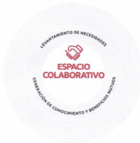
Figura 3. Representación del espacio colaborativo, modelo de Vinculación con el Medio UCSC

Tal como lo grafica el modelo de vinculación, el encuentro entre la comunidad universitaria y el medio externo se lleva a cabo en un espacio de colaboración, interacción y conexión constante. Dicho espacio no se refiere a un lugar físico propiamente tal, sino al encuentro de estos dos ámbitos: el interno de la UCSC y el externo compuesto por el territorio y sus agentes. De esta manera, este denominado espacio colaborativo busca propiciar la confianza, el respeto, reconocimiento y validación del otro, siendo un terreno fértil para el levantamiento de necesidades y, en torno a ellas, co-construir soluciones o respuestas efectivas, por medio de la generación de conocimiento y beneficios mutuos. Lo anterior, además permite avanzar en un cambio de paradigma al interior de la Universidad, transitando desde un hacer para el ciudadano, hacia un hacer con el ciudadano.